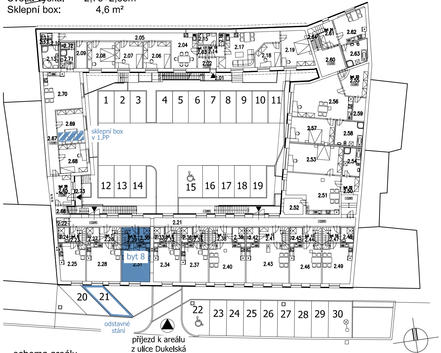
schema areálu 2.NP+zpevněné plochy

Podlaží: 2.NP+3.NP Bytová plocha: 55,5 m 2 Světla výška: 2,75+2,35m Sklepní box: 4,6 m 2